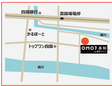
シンポジウム会場 MAP： OMO7 高知 by 星野リゾート （高知県高知市九反田 9-15）